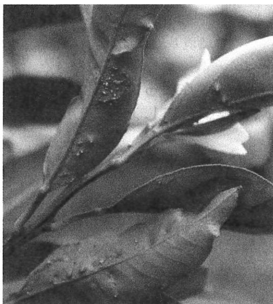
図2 病斑が形成された葉

(3) 窒素肥料が多いと栄養生長が盛んになり、発生が多くなるので、適正な肥培管理に努めましょう。