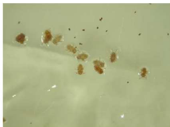
図3 ワセリンに付着した1齢幼虫