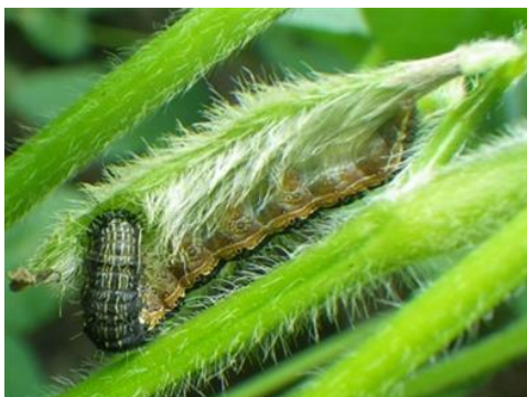
図2 ダイズの莢を食害する老齢幼虫

農薬の散布に当たっては、ラベルの表示事項を守るとともに、他の作物や周辺環境への飛散防止に努めましょう。