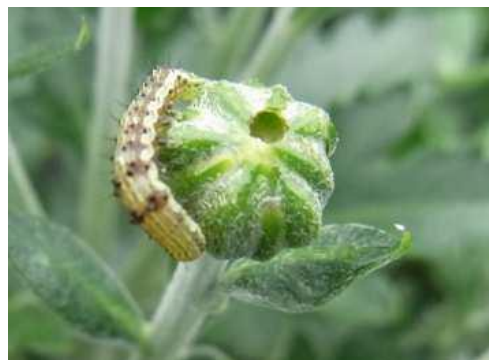
図3 キクの花蕾を加害するオオタバコガ幼虫